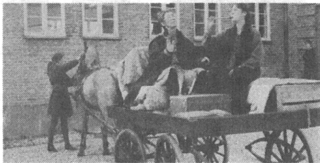
Til hest med piber og trommer

15.7.1984. Åbent Hus for lokalbefolkningen. Der kom ca. 70.